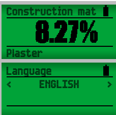
Pantalla Dot-Matrix con iluminación