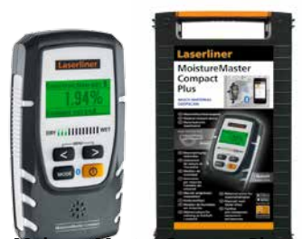
MoistureMaster Compact Plus con maletín + pila