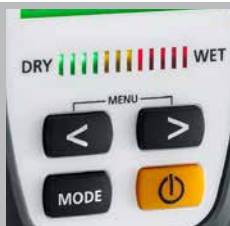
Indicador de húmedo y seco por LEDs de 12 posiciones